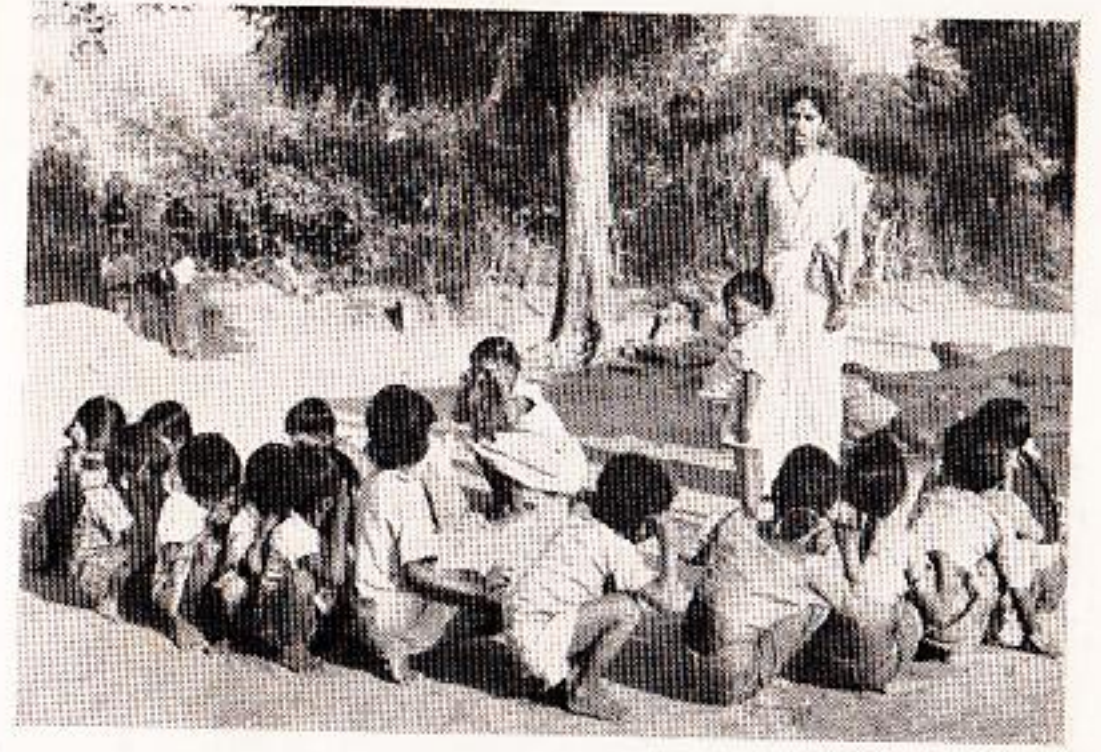
रानात भरणारी, तारावाईची कुरणशाळा